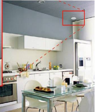
キッチン設置イメージ